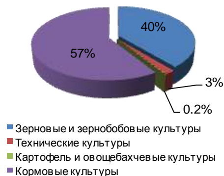
Структура посевных площадей в сельхозорганизациях Кировской области (в процентах ко всей посевной площади)

В силу природно-климатических условий, сложившихся в прошедший зимний период, гибель посевов озимых культур составила 2,4 тыс. гектаров - это 3% площади, засеянной осенью 2020 года, и в сравнении с аналогичным периодом прошлого года осталась на прежнем уровне.